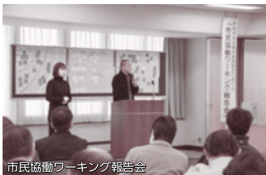
市民協働ワーキング報告会

報告会では、各テーマ共通のキーワードとして、「郷土愛」「つながり」「信頼」「交流」などが挙げられたほか、「自治(まちづくり)は楽しみながら進めていくことが大切である」という発表がありました。