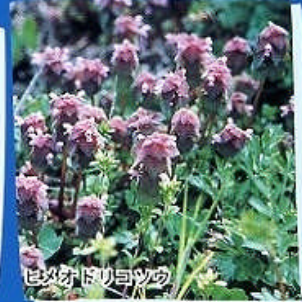
ヒメオドリコソウ