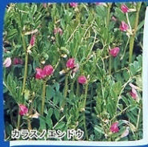
カラスノユシドク