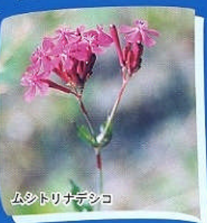
ムシトリナデシコ