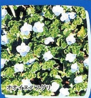
オオイヌノフグリ