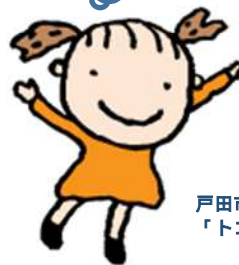
戸田市キャラクター 「トコちゃん」

戸田市では、保育士の皆さんを応援する 5つのメニューをよういしているよ。 詳しくは、裏面を見てね!!