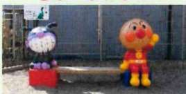
あんぱまんベンチ