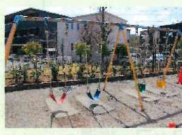
カラフルブランコ