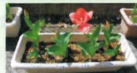
こどもたちが植えた ちゅーりっぷ

当園の園庭には様々な固定遊具があります。砂場も定期的に消毒を行っておりますので、安心・安全にご利用いただけます。花壇には季節のお花がきれいに咲いています。ぜひ、園庭開放に遊びにいらしてくださいね♪