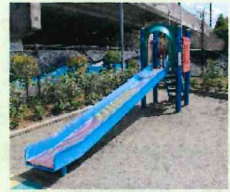
ローラーすべりだい