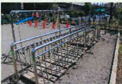
ゆらゆらつりばし