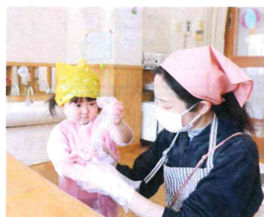
ビニール袋からおにぎりを出します。