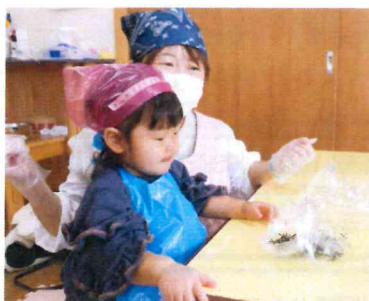
刻み海苔をかけました。