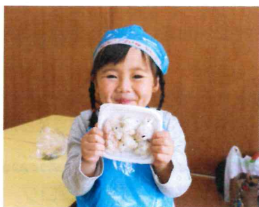
お弁当箱に入れて出来上がり！