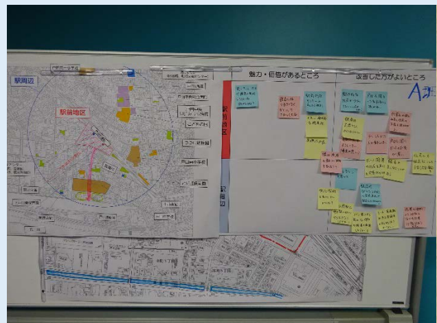
出された意見をまとめた模造紙