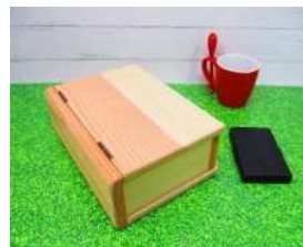
A:ブック型ボックス