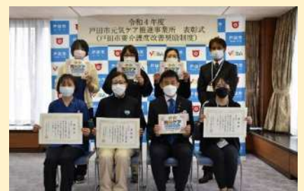
▲令和4年度の表彰式の様子