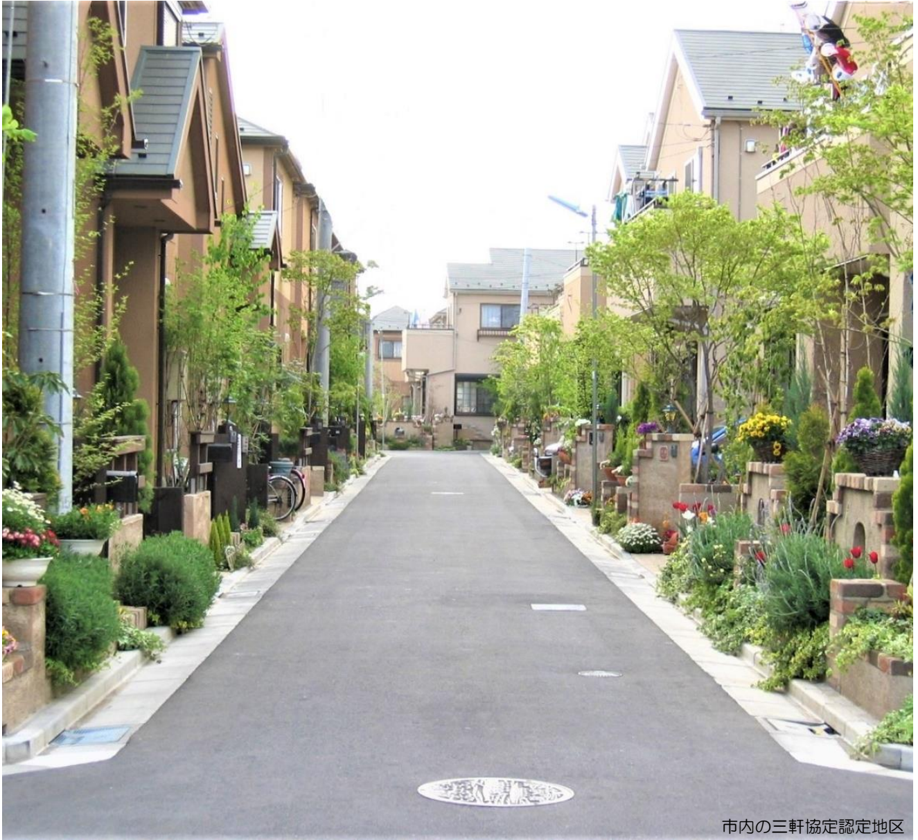
市内の三軒協定認定地区