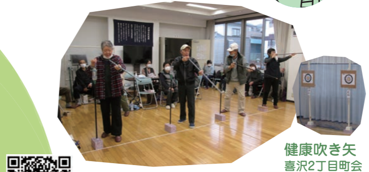
健康吹き矢 喜沢2丁目町会