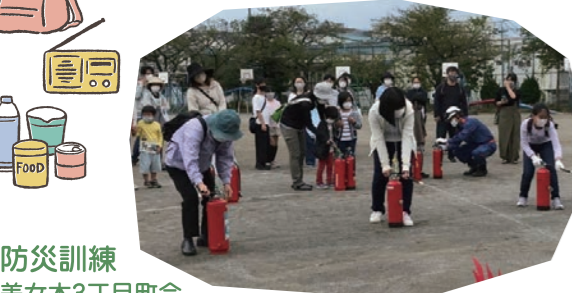
防災訓練 美女木3丁目町会 向田町会