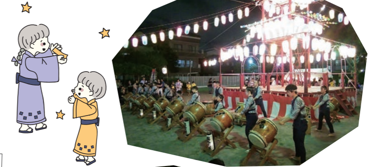
納涼盆踊り 喜沢1丁目町会