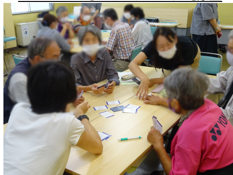
もしもの時のための人生講座

自分がこれからどうしていきたいのか自分の人生を考え直すきっかけの場になりました。