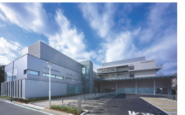
市民医療センター 一般診療のほか、各種予防接種、在宅療養支援のためにリハビリや往診なども行っています。