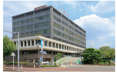
戸田市役所 昭和45年10月に完成。事務室、市議会フロア、本会議場などがあります。