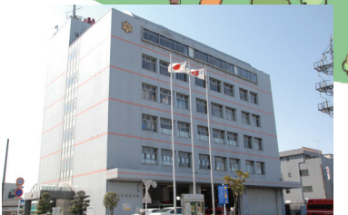
消防本部 戸市内の119番は、全てここに通報され、救急・消火活動を迅速に行っています。