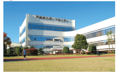
スポーツセンター 屋内、屋外ともに充実したスポーツ施設です。各種スポーツ教室なども開催しています。