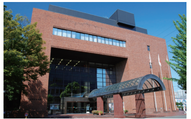
文化会館 1,210人を収容できる大ホールでは、コンサート、音楽祭、古典芸能など行われます。