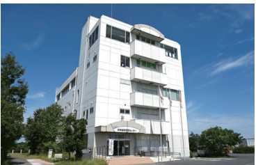
彩湖自然学習センター (みどりパル) 荒川の自然と川の防災について学べる施設。川と自然をテーマにした展示もあります。