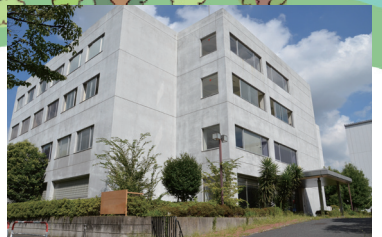
新曽南庁舎 (新曽南多世代交流館「さくらパル」) 水道料金・下水道支払い窓口のほか、地域住民の交流の場として「さくらパル」があります。