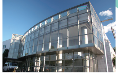
笹目コミュニティセンター (コンパル) 多目的ホール、キッチンスタジオなどがあり、各種講座やサークル活動などが行われています。