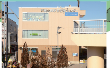
戸田公園駅前行政センター パスポート申請・交付手続きなども行える駅前の複合施設。「子育て広場」もあります。