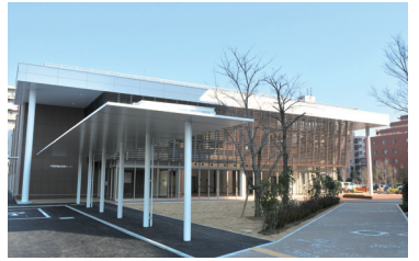
福祉保健センター 子どもから高齢者までの福祉と保健に関する支援を実施。社会福祉協議会もあります。