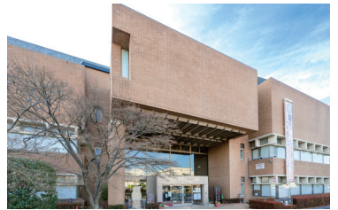
中央図書館・郷土博物館 約40万冊の蔵書。文学講座、絵本の読み聞かせなど実施。古文書や地図なども閲覧できます。