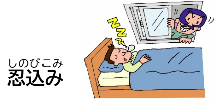
しのびこみ 忍込み