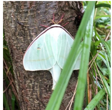
オナガミズアオの成虫

戸田では県のチョウ「ミドリシジミ」を呼ぶために道満グリーンパーク内にハンノキをたくさん植えています。ミドリシジミもハンノキを食草にするからです。ミドリシジミもとてもきれいなチョウで私も大好きですが、もっと好きなオナガミズアオにも、とてもいい環境になったはずです。幼虫の食べ物がたくさんあるのですから。