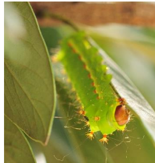
オオミズアオの幼虫 顔が茶色