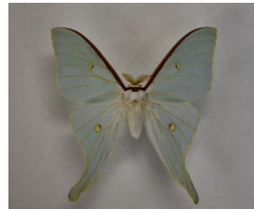
オナガミズアオ成虫 10センチメートル けっこうおおきい

さてこのオナガミズアオの幼虫は、ハンノキの葉を食草にします。成虫の姿がとてもよく似ている「オオミズアオ」というガもありますが、こちらはどちらかというクヌギやコナラの葉を食草にします。どちらも大きくてかわいい幼虫です。