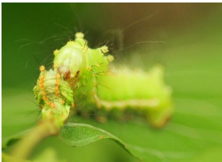
オナガミズアオの幼虫 顔が緑色