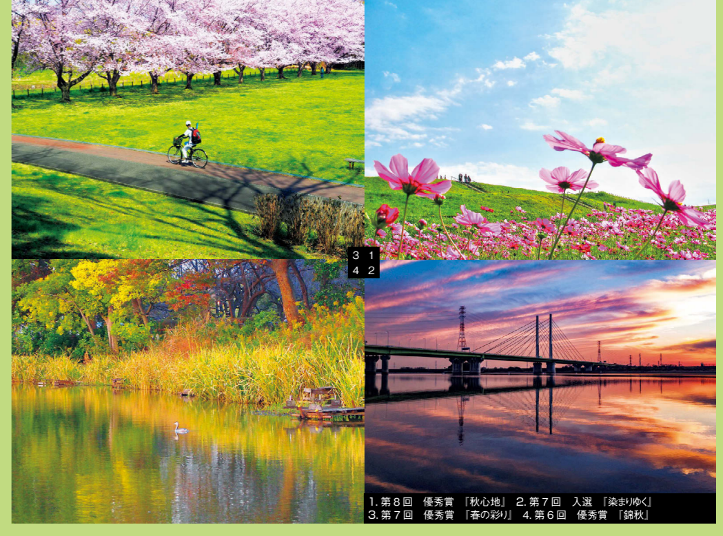
1. 第8回 優秀賞 「秋心地」 2. 第7回 入選 「染まりゆく」 3. 第7回 優秀賞 「春の彩り」 4. 第6回 優秀賞 「錦秋」