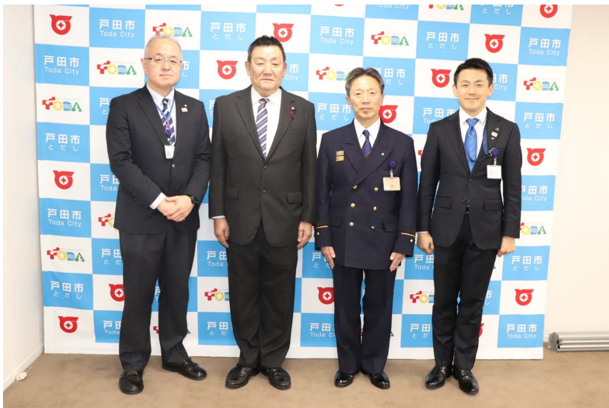
令和2年3月31日団長退任式