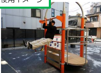
写真：複合健康器具