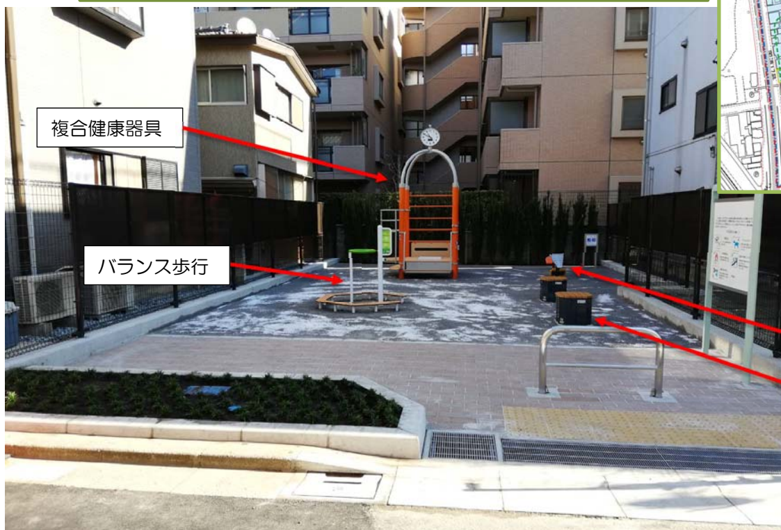
写真：川岸げんきミニパークの全景

「川岸げんきミニパーク」には、災害時に「防災トイレ」としても利用できるトイレスツールや、平常時にも利用できる3種類の健康器具（複合健康器具・ジワジワ前屈・バランス歩行）を整備しましたので、日頃からの健康増進にお役立てください。健康器具の使用方法については、各器具の付近に説明板がありますので、ご無理のない範囲でご利用ください。