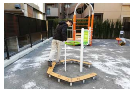
写真：バランス歩行