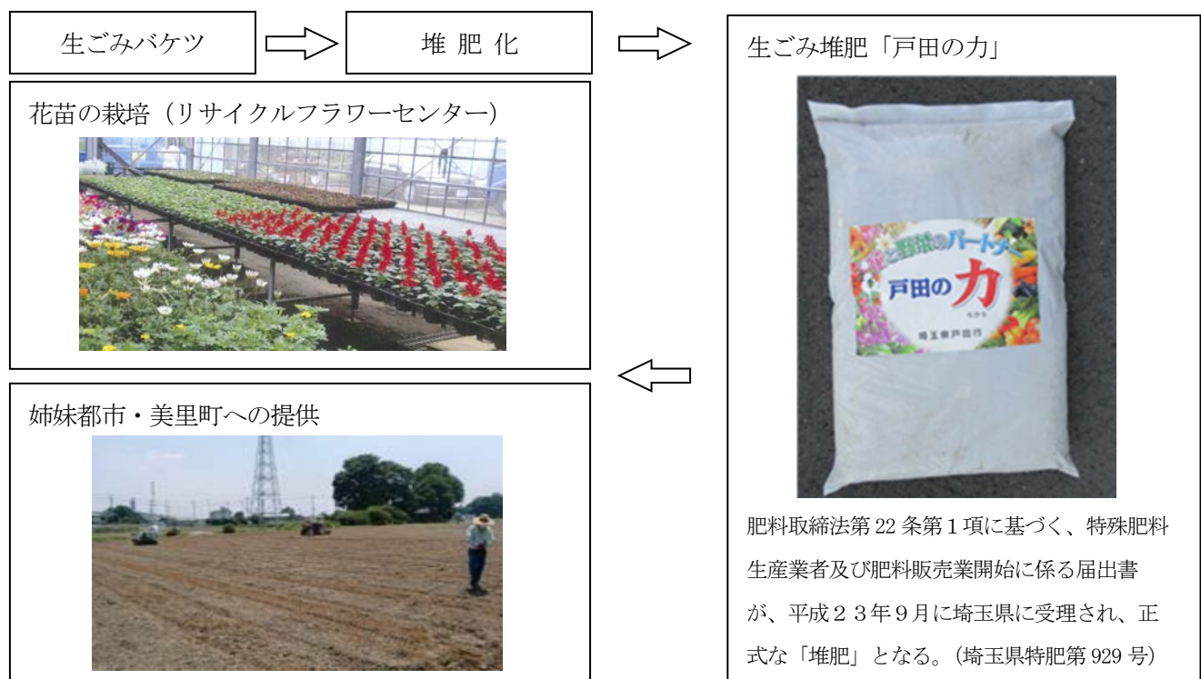
図 5-1-1 生ごみの堆肥化について

なお、同センターにて製造された生ごみ堆肥「戸田の力」については、花苗の栽培に活用しているだけでなく、姉妹都市である美里町の農地へ搬入し、現地の農家にご協力いただきながら、白菜の低農薬栽培を実施しており、学校給食の食材としての利用や、イベント時の産直販売等により幅広く活用し、本市における食品リサイクルの先駆的な取組みとなっている。