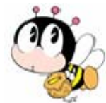
生涯学習マスコット マナビイ

場 所 戸田市文化会館3階 304会議室 時 間 午後2時～3時30分(受付は午後1時30分から) 対象・定員 市民20名(他に市職員、教員、行政委員の参加あり) 認定単位数 4単位 持ち物 筆記用具、メモ用紙等 申込方法 一般市民は10月2日(火)より受付開始。電話・FAX・メールにて下記 まで氏名・住所・電話番号をお知らせください。 ※PTAは各学校でまとめてお申込み下さい。 主 催 戸田市 戸田市教育委員会 戸田市人権教育推進協議会