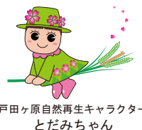
戸田ヶ原自然再生キャラクター とだみちゃん