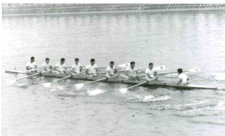
東京オリンピックエイト日本クルー